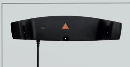
CW1 Настенное зарядное устройство [05]