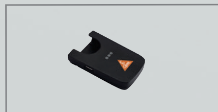
CC1 Зарядный кейс [02]