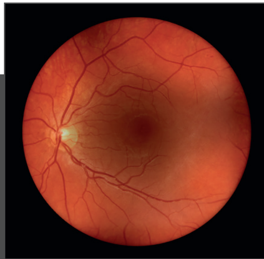
Вид сетчатки через катаракту с помощью системы visionBOOST*.