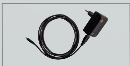
E4-USBC Сетевой адаптер с кабелем [04]